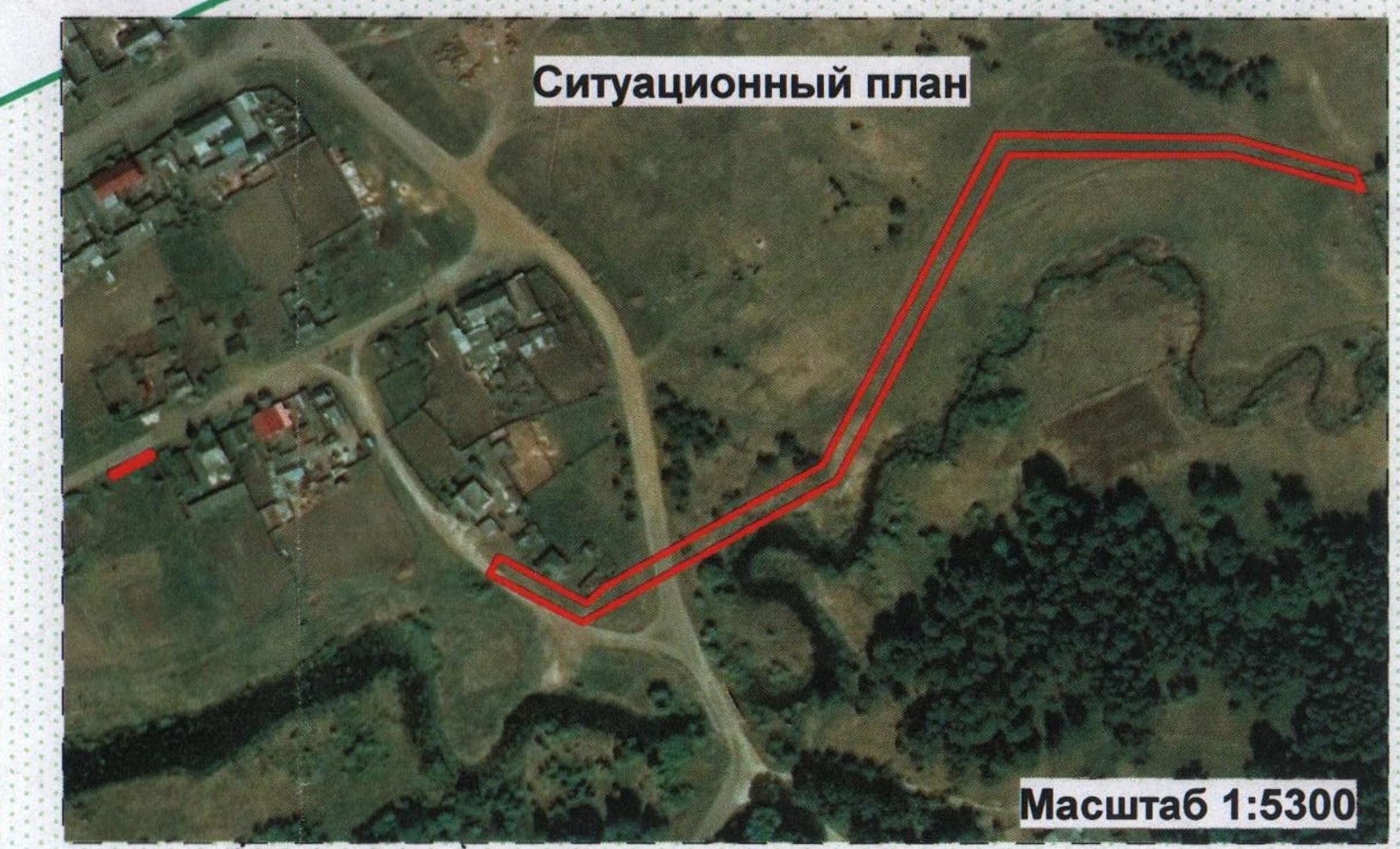
Каталог координат границ сервитута МСК-45, зона 2

Местоположение: Курганская область, Белозерский район, с. Зюзино